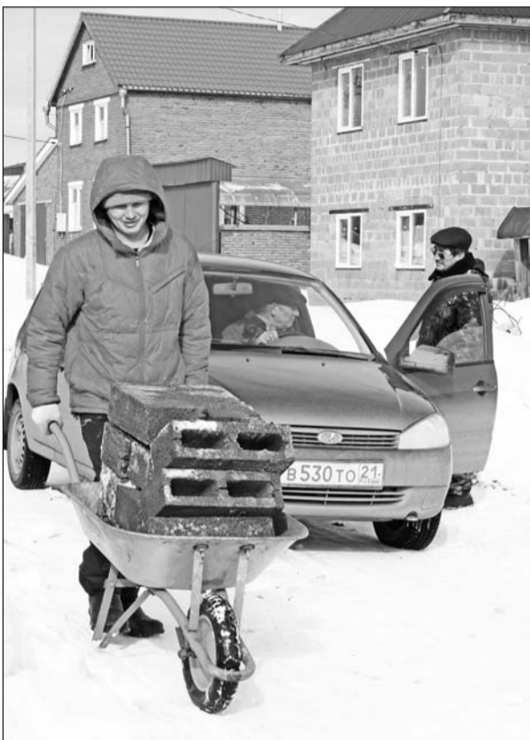
● ЯЛТА СЎРТ ШУЧĔ ТЕ,

Пахча хыçенчен 500 метр-танах свалка пусланакан ялта çынсем мĕнле пураннăши? Вёсен урăх çĕре куçма та май пулнă вĕт. "Аттеанне суртне епле пăрахан? Эпир çакантах тымар янă", – каласава хутшăнаççĕ аслă ħру çыннисем. Тухса кайса урăх çĕрте вырнаçма, паллах, укçа-тенкĕ кирлĕ. Тен, çаванпах çине тăман вёсем? Ял пĕтсе мар, пача тепĕр май, ўссе пыни вара куç умĕнчех.