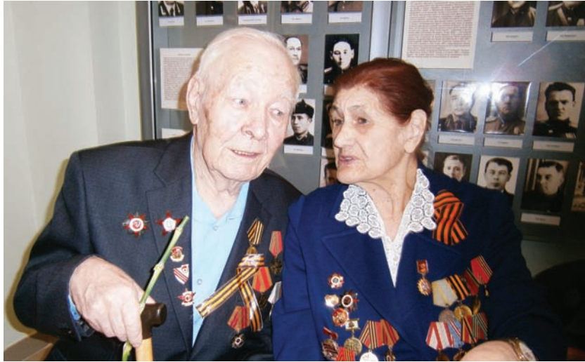
Республикари пин те пилĕкĕре яхăн медицина ёсĕненĕ Тăван сĕршывăн Аслă вăрçине хутшăннă: 55-шĕ тăван киле таврăнайман, 17-шĕ хыпарсăр сухалнă.

Тухтăрсене хушма пĕлў паракан институт сўртĕнче вăрса хутшăннă медицина ёсĕненĕсем сиччен каласа кăтартакан стендсем хатĕрленĕ.