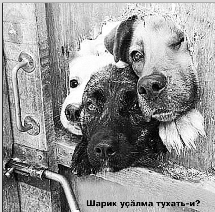
Шарик уcĀлма тухать-и?

– Ниcта та пĀрĀнмалла мар: ак cĀпла – кухня витĕр тĕптĕррĕнĕх малалла вĕcтерĕр, – ним пулман пек хуравлатĕ кинемей те.