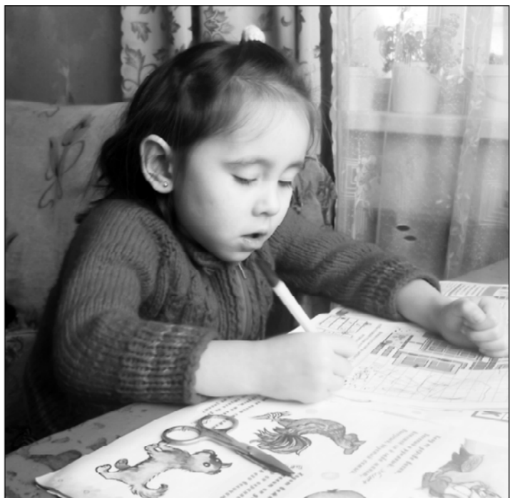
Садик суккипе Вероника килтех сӑрма-вулама хӑнӑхатъ.

Хӑллекхи уяр та пит-куґа сӑмӑях хӑмлентерекен сивӑ кун. Кӑнаш районӑнчи Воронцовкӑна ситсе курма тӑвӑлленӑ шухӑшӑма сӑнталӑк та чараймӑр. Ачӑ чи хӑрринчи кил тӑлӑнче машинӑран аґса юлтӑм та ял урамӑе ерипен утатӑп. Хама кӑсӑклантаракан сӑмӑе хӑш суртра пурӑнма пултаринне чун сисӑмӑе палласа илессе-шухӑшлавӑн яланхи аскӑнӑчӑклӑхӑе.