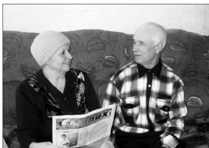
апатланакансене, сӑвап пултӑр сӑкӑнӑш.