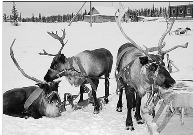
• ВYРĂНТИ ТРАНСПОРТ.

«Нумай йывăс, чечек ўсенкен парк кирлĕ пире. Унта тĕрлĕ аттракцион ырнаçтар-