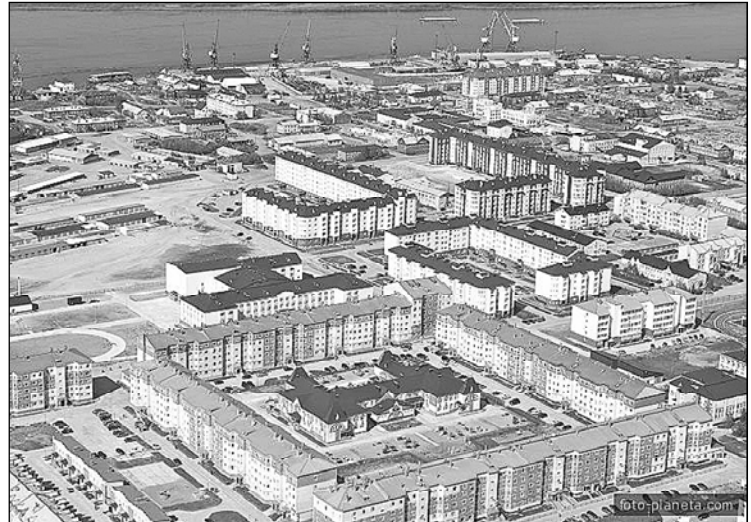
• НАРЬЯН-МАР ХУЛИ АТАЛАНСАХ ПЫРАТЬ.