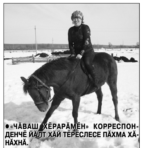
● «ЧĂВАШ ХĔРАРАМĔН» КОРРЕСПОНДЕНЧĔ ЙĀЛТ ХĀЙ ТĔРĔСЛЕСЕ ПĀХМА ХĀНĀХНĀ.