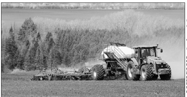
Г. ВЕРБЕЛОВДОВ сån, Укерчëкë

республикипе талåра вåтамар 12 пин ытла гектар тырå акнå, уйрån кунсенче 17 пинрен те иртнë. Юлашки вåхåтра хåвårтрлåх чакни сисенет. Сакå, ахårтнех, техникån пёр пайлë сёр улми пуссине кунсипе сыхånнå ёнтë. Унсår пуçне чылай хуçалåх пахча симёс, сахар кåшманë, горчица, ытти кулштура та ситёнтерме тёллев тытнå.