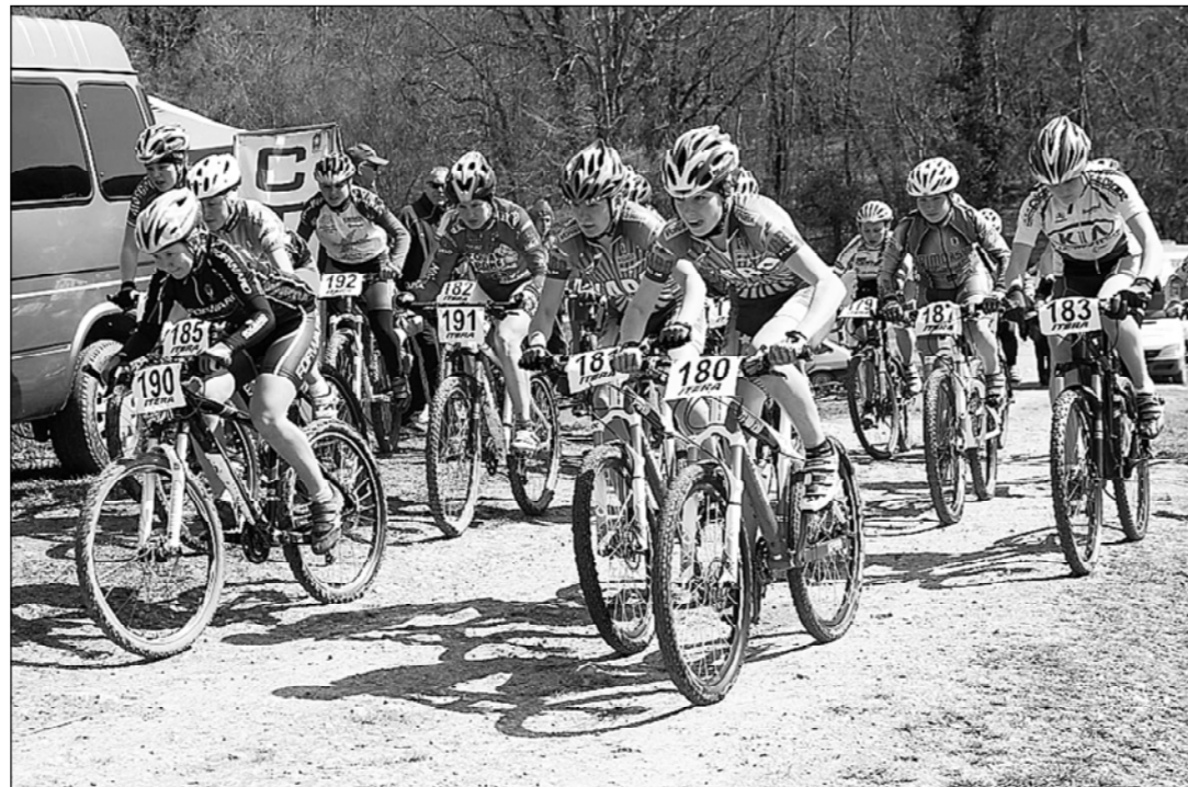
нова никәм та ситәймән. Нумаи пулмәстә Чәваш Ен велосипедсәнә Сәнә Шупашкар ху-