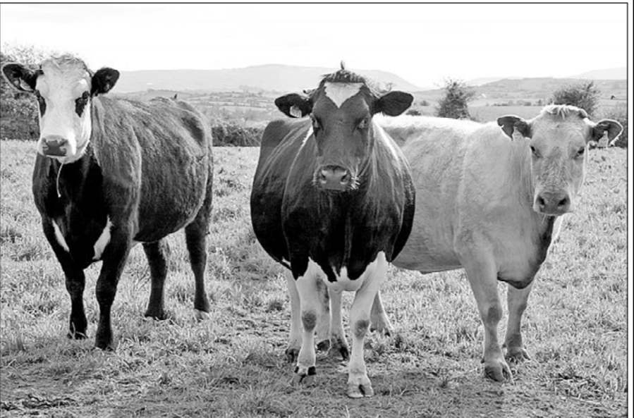
Кунашкӧлли СХХПИ сотрудинокӧсене те килӧшмӧст

Кунашкӧл тӧрӧслев вӧхӧтӧнче инспекторсем пӧрешкел кӧлтӧксемпӧ тӧл пуласӧ. Сул сичне чарнӧ сынсен ыльӧх, унран хатӑрленӧ продукция, ыльӧх апачӧ е тӧрлӧ хутӧш тӧлӧше ветеринари докуменчӧсем сук. Сӧвна май 7 сынна админист-