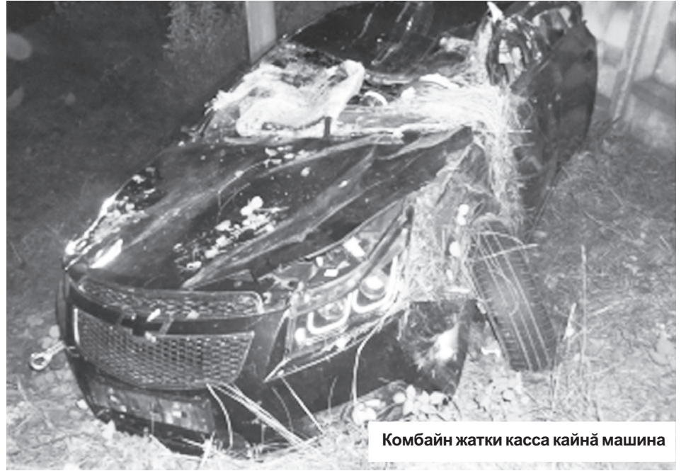
Комбайн жатки касса кайнӑ машина

Ӑҫта йӑрке ҫине ытларах алӑ сулнӑха? Пӑтӑмлетӑ тӑрӑх ҫакӑ курӑнат. Красноармейскипе Шупашкар районӑсенче техника сул ҫӑрев хӑрушсӑрлӑхне тивӑҫтермен. Шупашкар хулинче тата Муркаш районӑнче техникӑна