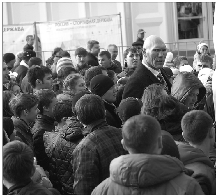
/Вĕçĕ. Пуçламăшĕ 1-мĕш стр./

Çапла вăл салтака кайичченех профессионал шайĕнче выляма вĕренсе çитнĕ. Салтак атти тăхăнсан Сывлăш-Çар ретне лекнĕ. Кунта хастарисене кăна йышăннине кашниех пĕлет.