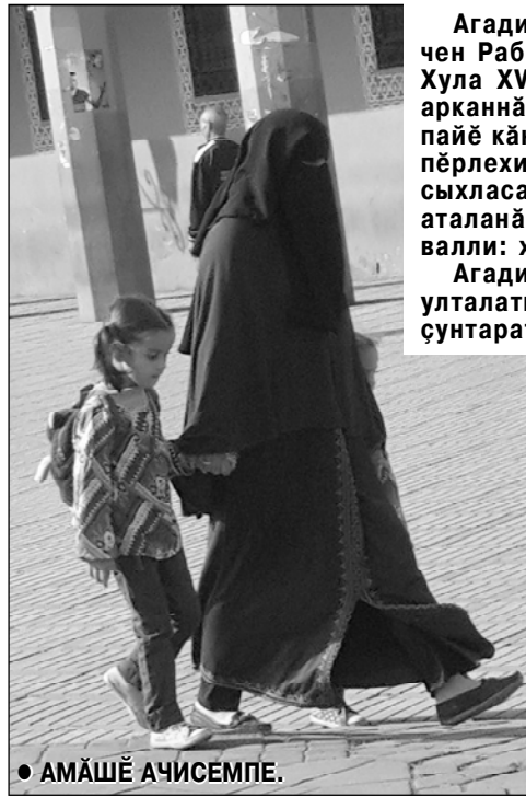
● АМАШӨ АЧИСЕМПЕ.

Агадирта сёртме-утә уйәхөсөнчә 50 градуса сити шәрәх пулма пултартатә. Анчах та океан улталатә – усә сил вёрнине пула пачах шәрәх туйәнмасть. Хөвел вара сәв вәхәтра сывәрмасть – сунтаратә кәна. Сәвна сисмесёр сүтә үтлө туристсем туххәмрах писсе сөвөнөсчә.