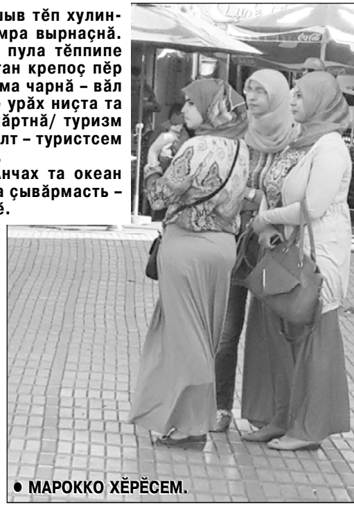
● МАРОККО ХӨРӨСЕМ.