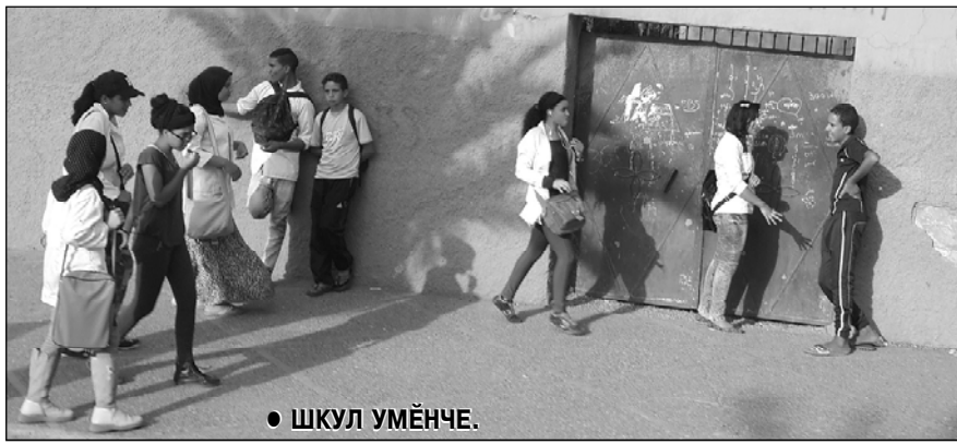
● ШКУЛ УМӨНЧЕ.