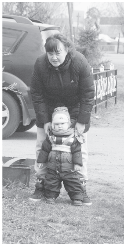
Асанне патӓнче хӓнара