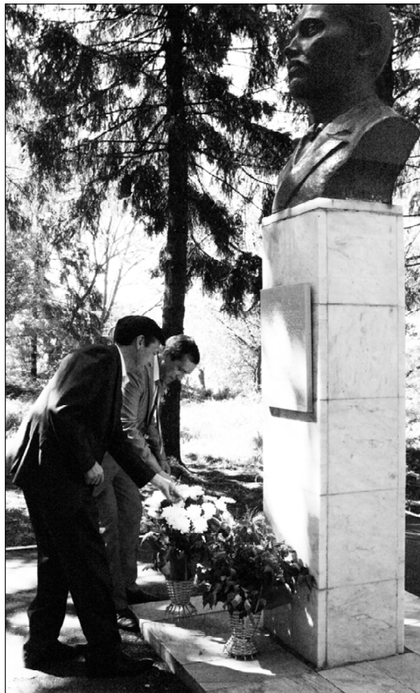
Николай Васильевич палӑкӗ умне чечексем хучӗҫ. Илемлӗ юрӑ-кӗвӗ шӑрантаракансем уява малалла тӑсрӗҫ.