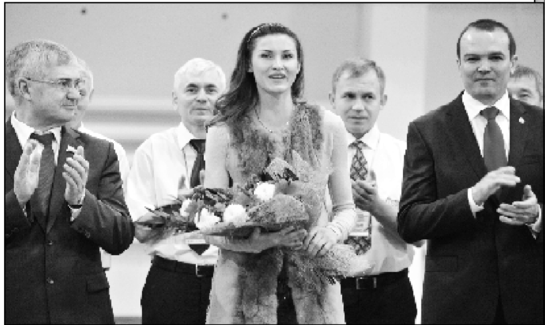
Шăмат кун Çĕнĕ Шупашкарти Олимп резервĕсен ятарлă 3-мĕш спорт шкулĕн çĕнĕ менежĕ сăмăл атлетикăна юратакансене йышăнчĕ. Унта Чăваш Ен Пуçлăхĕн кубокне çĕнсе илессĕн Пĕтĕм Раççейри ģмăрту иртĕ.