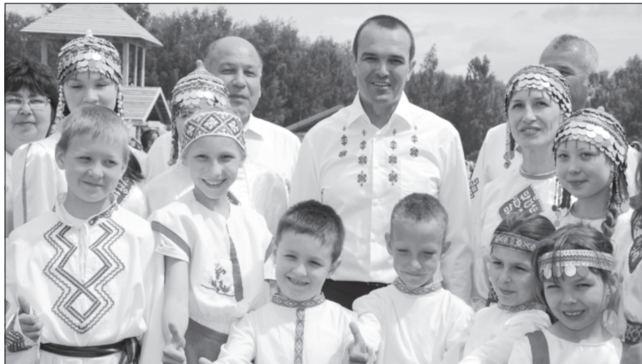
Сәнүкерчөкесе www.cap.ru сайтран илнө

Шупашкар район депутатёсен пухавё Михаил Игнатёва «Чәваш Республикин