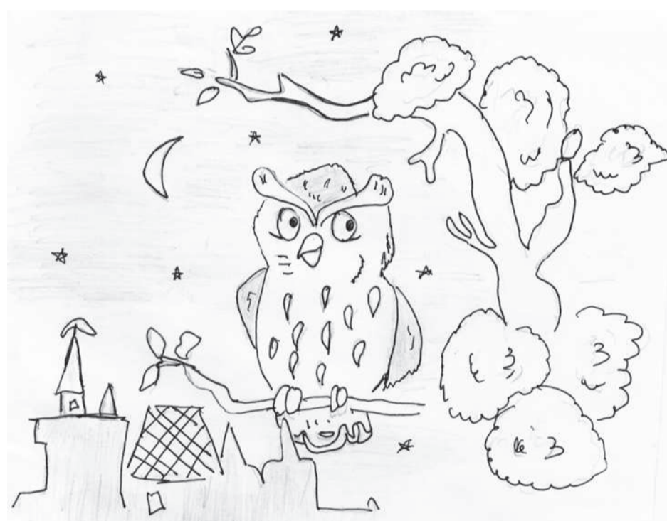
© Даша МИХАЙЛОВА (Йөпреç районө, Сәкаләх) үкөрчөкө.