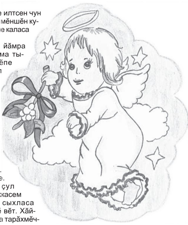
© Катя КОШЕЛОВА (Йӑпреҫ районӑ, Ҫӑкалӑх) ӑкӑрчӑкӑ.

– Хамӑра сӑтӑр тӑвакана хӑрхенетӑн пулатӑ! Кӑҫӑх чӑпсем тухмалла. Вӑсене мӑнле сыхласа ҫитерӑпӑр? Халех кайса