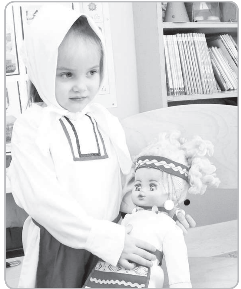
• Ғак сөхетре, Ғак минутра, Ғак ҕөкунтра Ғак таврари шәпләхра Шәпчәк суралать. Шәп пуләр!

Унән сәмахөсем сунатлантарчөҕ. Апла пулсан мана аннепе асанне чәнахах юратаҕҕё.