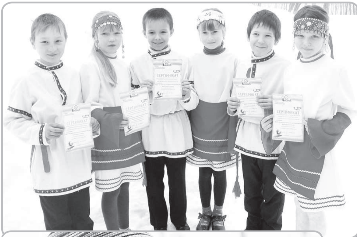
• Чөвө-чөвөл ҕөҕсисем Хүме сүмне сәрәннә. Ғакә ялән ачисем Хөрсен сүмне сәрәннә.