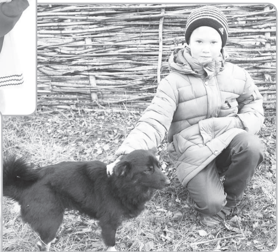
• Сарри-сарри саррипе, Хури-хури хурипе, Тимёр карта туллипе И эс чипер, эп чипер, Чән чиперри ҕак ачи!