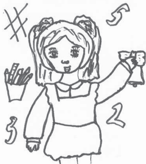
© Анна МИХАЙЛОВА (Йӑпреҫ районӑ, Ҫӑкалӑх) ӑкӑрчӑкӑ.

– Чимӑр, асанне ӑҫта пирӑн? – ял сиксе тӑчӑ аппа.