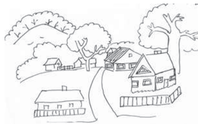
• Даша МИХАЙЛОВА (Йөпреҗ районө, Ғәкаләх) үкерчөкө.