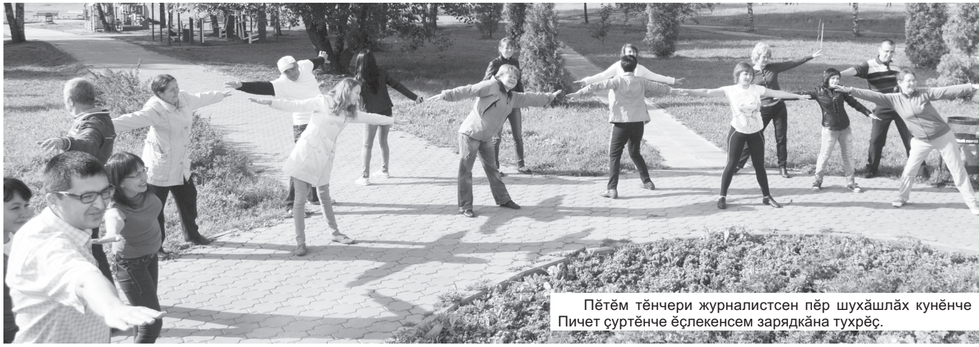
Пĕтĕм тĕнчерĕ журналистсен пĕр шухăшлăх кунĕнче Пичет суртĕнче ёслекенсем зарядкăна тухрĕс.